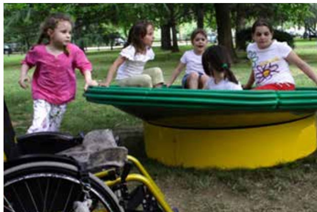
Fotografije: Nidondolo u parku Sasso Marconi – Bolonja - Italija – godišnji kongres Udruženja ASBI spina bifide Italije, (© Arh. Mitzi Bollani – Maj 2006.)