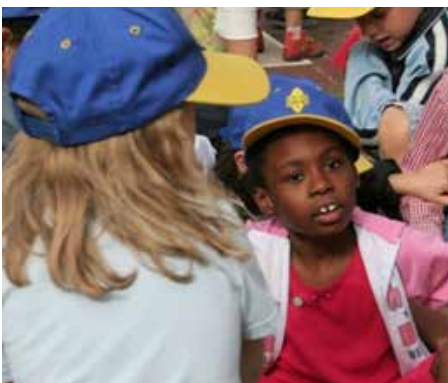
Fotografija: Nidondolo u parku Galleana – Pjaćenca, Italija – sa devojčicom sa autizmom, koja se dobro integrisala u grupu za igru. (© Arch. Mitzi Bollani – Maj 2007.)

PRISTUP ZA SVE a ne samo za decu ograničenih aktivnosti.