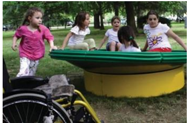
Fotos: Nidondolo no Parque Sasso Marconi – Bologna – Itália – Congresso Anual da ASBI – Associação Espinha Bífida, Itália