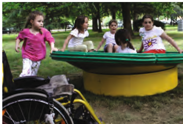
Nuotraukose: „Nidondolo“ žaidimas Sasso Marconi parke (Bolonija, Italija) ir metinis Italijos spina bifida asociacijos ASBI suvažiavimas (© Arch. Mitzi Bollani – 2006 m. gegužė)