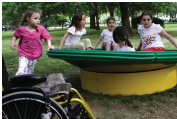
Fotos: Nidondolo en el Parc Sasso Marconi – Bolòña - Itàlia – Congrés Anual d'ASBI – Associació d'Espina Bífida d'Itàlia, (© Arch. Mitzi Bollani - Mayo 2006)