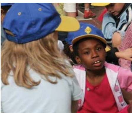
Foto: Nidondolo en el Parc Galleana – Piacenza – Itàlia amb una nena amb autisme, ben integrada en el grup del joc. (© Arch. Mitzi Bollani - Mayo 2007)

ACCÉS PER A TOTHOM , i no només per a nens amb limitació d'activitat. Nidondolo és un joc nou que treballa de diferents maneres i per això atrau a tots els nens, facilitant la integració i el joc en grup.