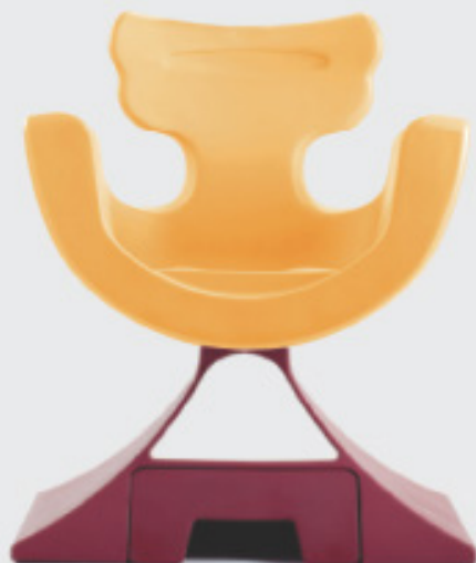
Arancio 41 L.