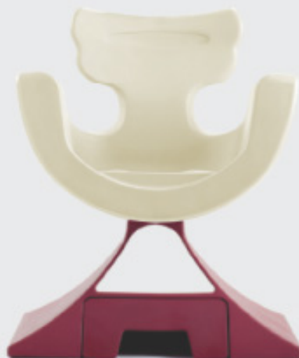
Bianco 1200 L.