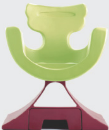
Verde 1816 L.