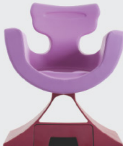
Viola 5947 L.

La poltrona MimmaMà può essere realizzata anche in altri colori per un minimo di dieci pezzi.